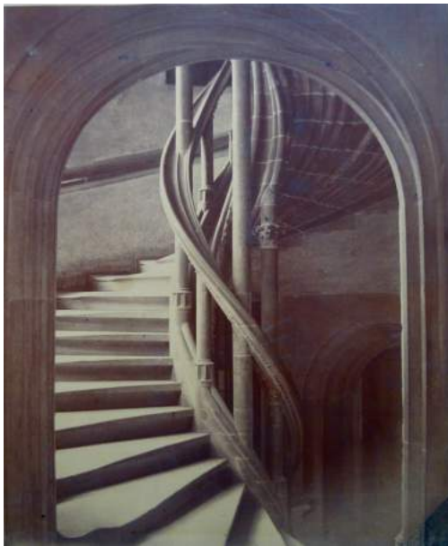
Dorothea LANGE, The Migrant Mother , 1936 >