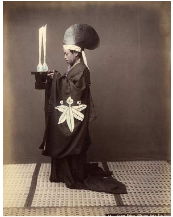
Raimund VON STILLFRIED, Prêtre Shintô, Japon , c. 1890 >