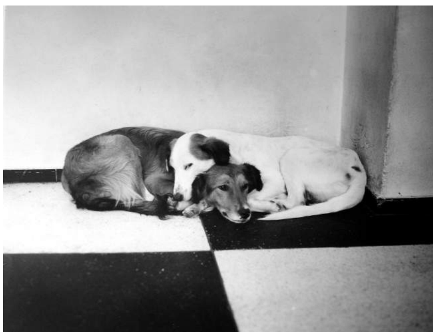
Giorgio Sommer, Moulage de chien à Pompéi , 1863 - c. 1880/ Jean-Paul Brohez Maroc (Ying et Yang) , 1989.