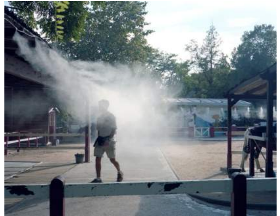
Gabriel DESPLANQUE, La Fumée , 2013 ^