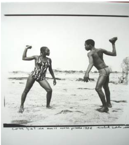
Malik SIDIBÉ, Combat des amis avec pierre , 1976